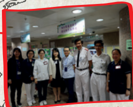
Kowloon, Hong Kong