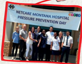
Pretoria, Jihoafrická republika