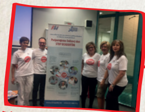
Plešň, Česká republika